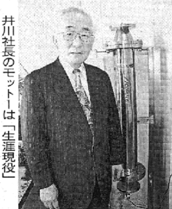
井川社長のモットーは「生涯現役」

本社・大阪市此花区、☎06・6469・1772 レス http://www.aquxite.co.jp/ ホームページのアド